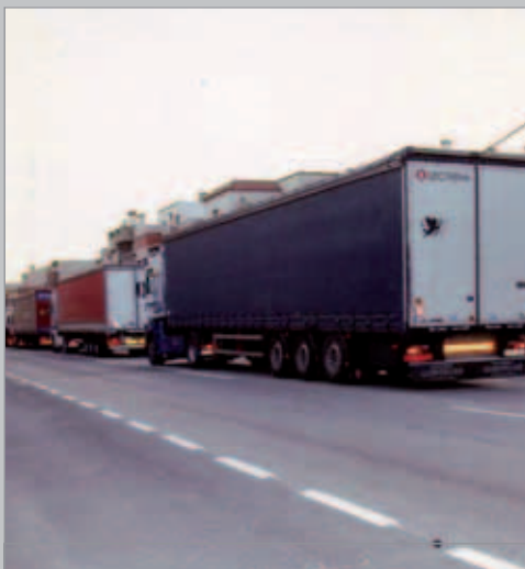
Dos anys esperant l'inici de la variant de l'Aldea