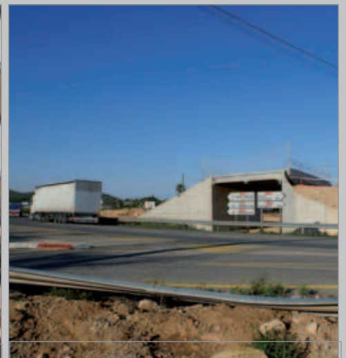
Paralització de l'àngol d'Alcanar, accés N-340