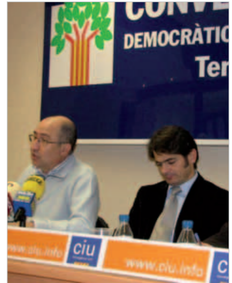
"CIU continua proposant projectes agressius per al nostre territori"

Esquerra va reunir d'urgència el Consell d'Alcaldes de la Ribera d'Ebre per tractar el tema i la conclusió va ser que cap alcalde preveia presentar candidatura al dipòsit de residus nuclears.