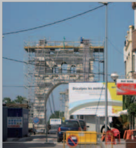
Retard en les obres del pont penjant d'Amposta