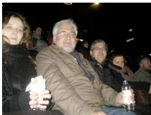
Diversos companys i companyes d'Esquerra al Camp Nou