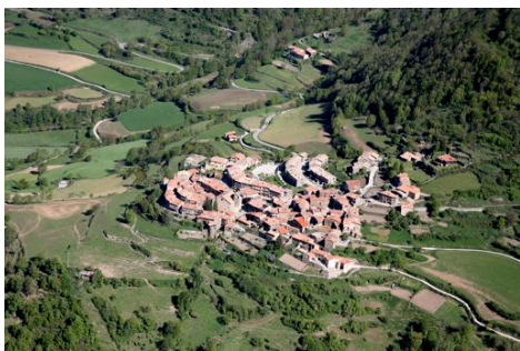
Imatge aèria del municipi de Pardines

E.P: Que siguin un gran pas per avançar en la recuperació de la llibertat nacional no en tinc cap dubte. Per una persona com jo que ara fa 25 anys que milito activament en l'independentisme la diada del diumenge és una fita que ni tant sols fa massa temps podia sospitar que arribaria. I a més, duta al poble, de s a c o m p l e x a d a m e n t, a m b transparència, llibertat i normalitat i