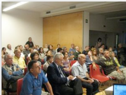
A la foto una de les dues reunions que ERC-Gràcia ha fet amb els veïns i veïnes del Parc Güell

Evidentment, el Parc Güell va ser el tema més destacable, pel públic i pel debat polític. Vam donar suport a la proposta de CiU i ells van donar suport a