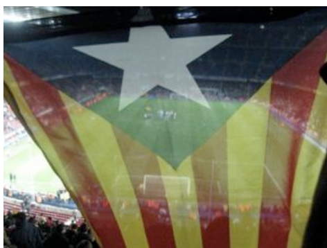
Una de les moltes estelades al Camp Nou