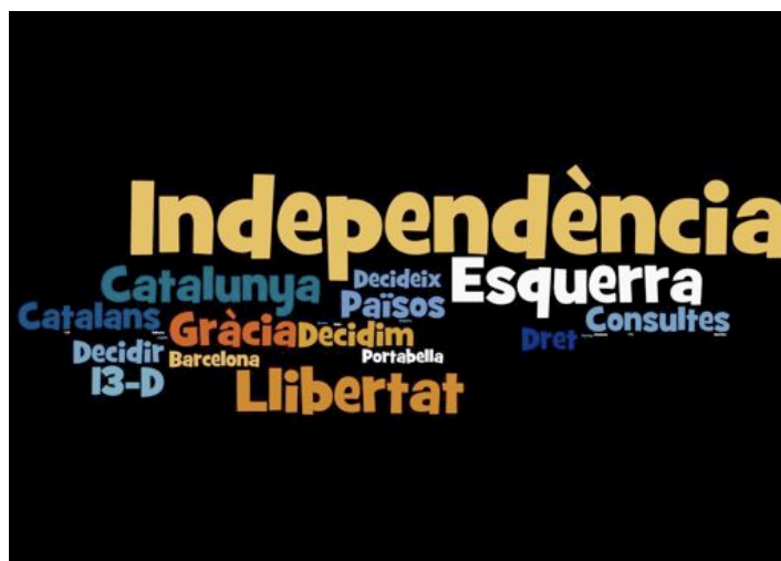
Imatge d'ERC Gràcia de suport a les consultes