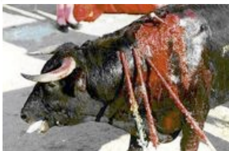
La ILP ha comportat reobrir el debat sobre les curses de braus

El president d'Esquerra ha deixat clar que 'no és una qüestió identitària, és un debat de caràcter universal acabar amb la tortura,