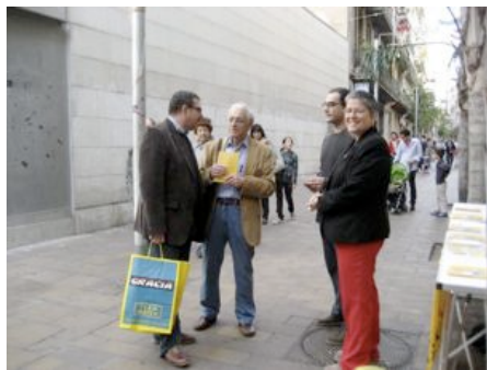
Diversos militants i veïns xerrant