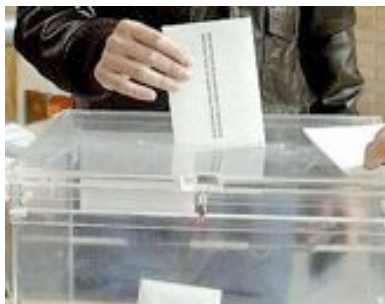
Votar als consellers i conselleres pot afavorir la proximitat

La Proposta d'ERC insta al Parlament de Catalunya a incorporar en la futura llei electoral catalana la possibilitat que aquelles ciutats que prevegin en el seu ROM la creació de Consells de Districte, puguin optar a l'elecció directa dels seus membres. I a continuació proposa “Iniciar un procés de modificació del ROM (Reglament Orgànic Municipal) per tal d'introduir l'elecció directa dels Consellers i Conselleres de Districte mitjançant llistes de vot preferent”.