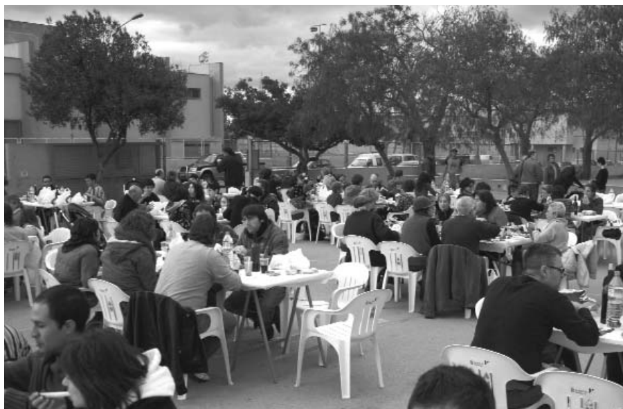
Prop de dues-centes persones ompliren el patí d'Es Canyar per menjar calçots

Alhora, el president, recordà la difícil decisió que va haver de prendre Esquerra en el moment en què va deixar les Institucions de govern de les Illes Balears, i remarcà que "si UM hagués estat honesta el PP no tendria