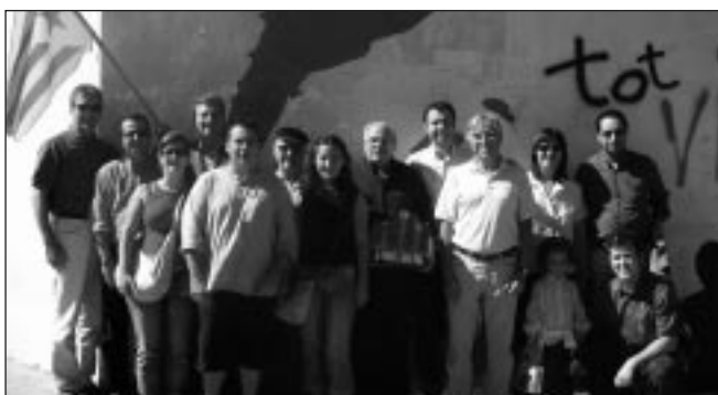
Militants d'ERC fent l'Ofrena a la placa del carrer Rafael Casanovas