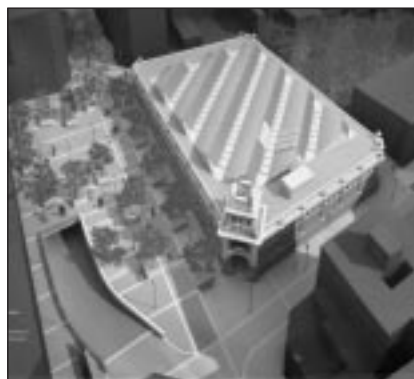
El nou equipament tindrà uns 2000 m 2 comercials i 214 places d'aparcament soterrades

del nou Mercat, però tot està sortint prou bé com per ser optimistes i pensar que la inauguració es produirà o bé per a la campanya de Nadal de 2006, o bé per a la Fira de la Candelera de 2007.