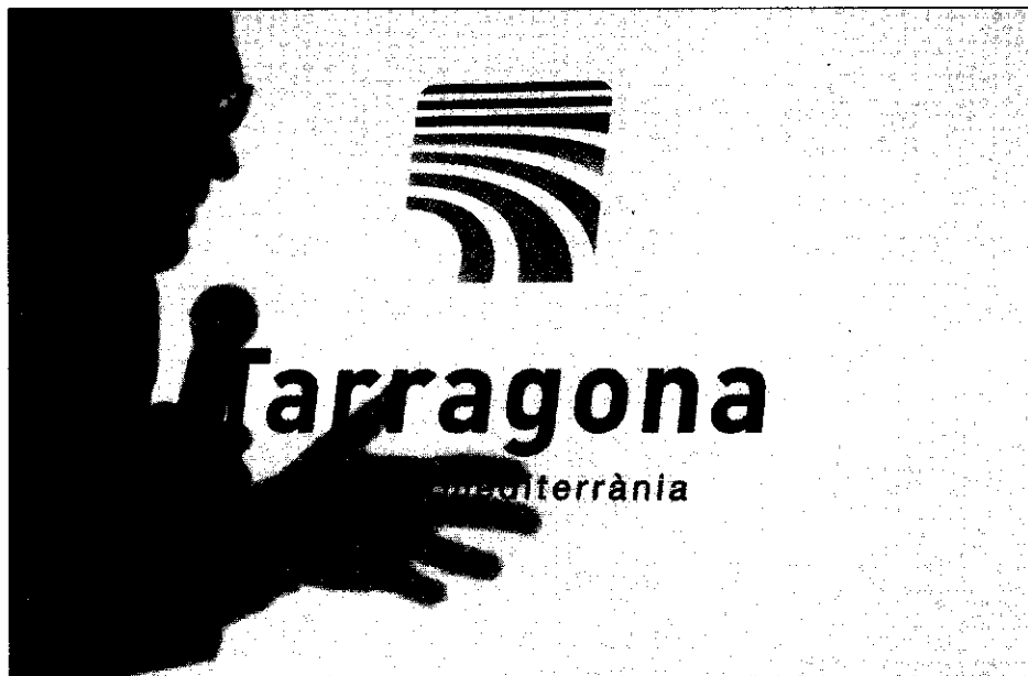
El nou logotip turístic té un cost d'uns 8 milions d'euros i ha estat escollit entre 40 propostes més.